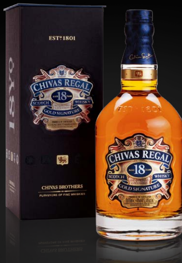
Chivas Regal 18 im exklusiven Geschenkkarton