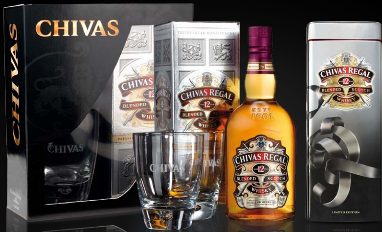
Chivas Regal 12 als Geschenkkarton mit 2 Gläsern oder in der edlen Geschenkdose